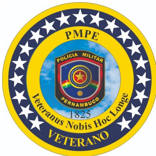
Modelo de Bóton de Veterano da Polícia Militar de Pernambuco para Oficiais