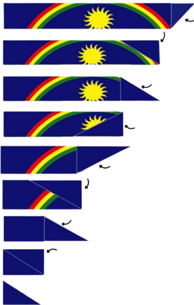
Figura 03 – Procedimento para a dobradura completa da Bandeira de Pernambuco.

c) 3ª Fase – Entrega solene da Bandeira Pernambuco: Trata-se do ato solene de entrega da Bandeira de Pernambuco à família do(a) falecido(a), a ser realizado antes da execução do Toque de Silêncio e da descida da urna fúnebre à sepultura ou local de cremação. Após a dobradura da Bandeira de Pernambuco, os 4 (quatro) policiais militares responsáveis por tal procedimento tomarão formação em linha de 1 (um) fileira, ladeando o militar designado da Unidade ou Comandante da Unidade, com frente voltada para o túmulo ou local de cremação do(a) falecido(a), momento em que entregarão a Bandeira de Pernambuco ao militar designado da Unidade ou diretamente ao Comandante da Unidade que, por sua vez, procederá a entrega solene para a família do(a) policial militar falecido(a), conforme figura 04.