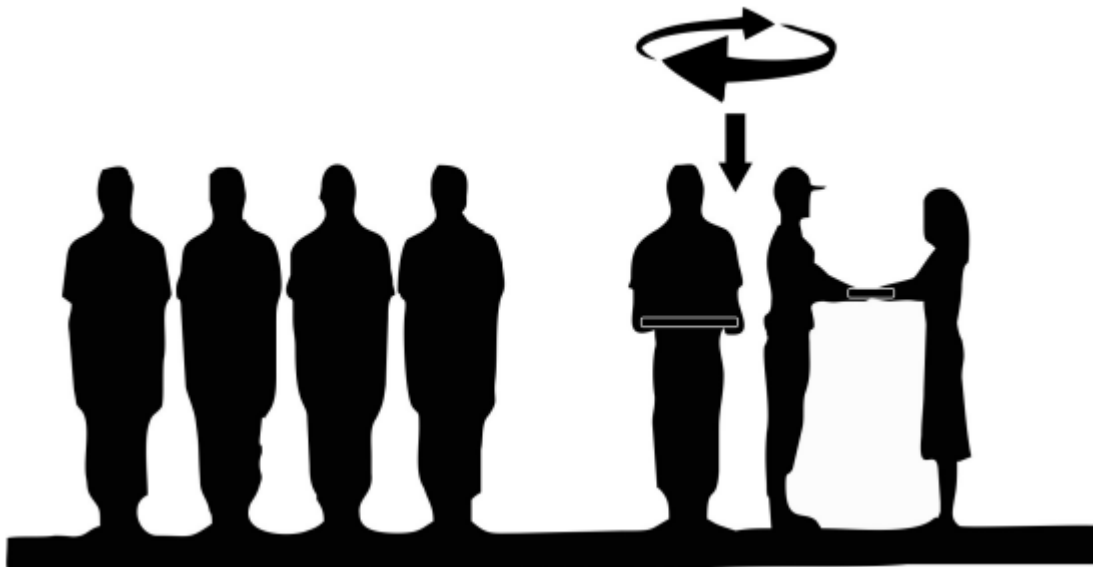
Figura 04 – Militar designado ou Comandante da Unidade procedendo a entrega solene da Bandeira. (SEI nº 3900000044.000129/2023-04).